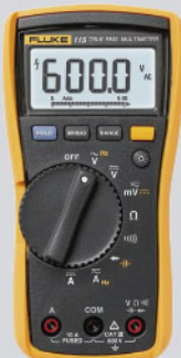
Multimetro digital Fluke 115 (EUR) / Ref: 2583583

PVP tarifa: 284€ PVP promoción: 249€ (precios sin IVA)