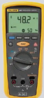
Comprobador de resistencia de aislamiento Fluke 1507 / Ref: 2427890

PVP tarifa: 793€ PVP promoción: 714€ (precios sin IVA)