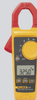
Pinza amperimétrica Fluke 325 / Ref: 5065866

PVP tarifa: 337€ PVP promoción: 310€ (precios sin IVA)