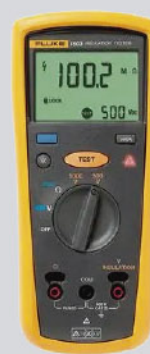
Comprobador de resistencia de aislamiento Fluke 1503 / Ref: 2427883

PVP tarifa: 640€ PVP promoción: 576€ (precios sin IVA)