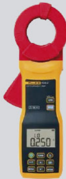
Pinza de medida de resistencia de tierra Fluke 1630-2 FC / Ref: 4829532

PVP tarifa: 2.317€ PVP promoción: 2.079€ (precios sin IVA)