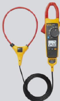
Pinza amperimétrica Fluke 376 FC / Ref: 5065965

PVP tarifa: 775€ PVP promoción: 636€ (precios sin IVA)