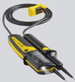
Comprobador de dos polos 2100-Alpha, versión led / Ref: 4312495

PVP tarifa: 89€ PVP promoción: 79€ (precios sin IVA)