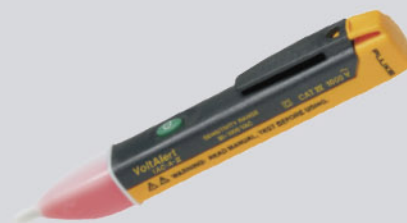
Comprobador VoltAlert sin contacto Fluke 1AC-E2-II / Ref: 2432971 Fluke 1AC-E1-II / Ref: 2432967

PVP tarifa: 46€ PVP promoción: 41€ (precios sin IVA)