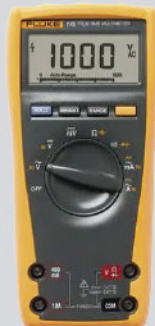
Multimetro digital Fluke 175 / Ref: 1645981

PVP tarifa: 369€ PVP promoción: 332€ (precios sin IVA)