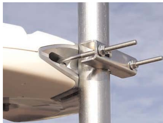
facilidad de montaje

Sencillez de montaje. - La antena, bajo el lema “easy to install”, siglas inglesa que ya suena en todos los mercados, se presenta de una sola pieza a la que solo es necesario conectarle el cable de conexiones y colocar la mordaza contra el mastil en la polarización adecuada. Por su vistosidad, la antena Diginova puede instalarse en cualquier parte de un edificio, ya que por su especial diseño se puede catalogar como una antena de muy bajo impacto visual.