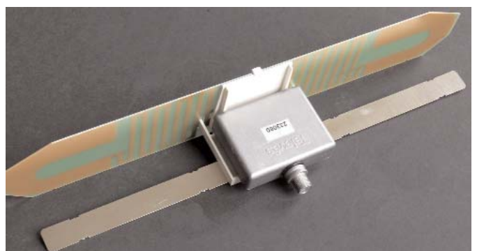
dipolo impreso y MRD blindado

Con la introducción del concepto del MRD de Televes, se