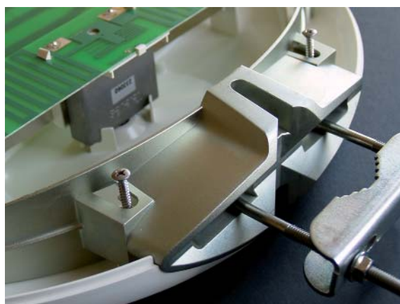
reflector y mordaza integrados en una única pieza de zamak

Versatilidad. - Es una antena compatible con múltiples configuraciones, al no necesitar una fuente de alimentación exclusiva. Entre otras muchas posibles configuraciones, se puede usar con una fuente activa, con un inyector de corriente, alimentando desde un receptor de tipo ZAS o desde una cabezera (AVANT, monocanales,...).